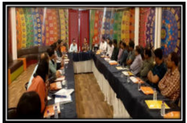
Alumni Meet 2023 at Hotel Tim Luck Luck, Pune