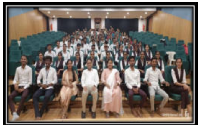
Students participated in training with Resource person and T&P team