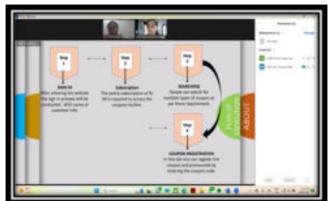
Screenshot of participants explaining the business model