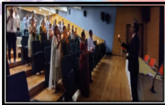
Inaugural activity in the FDP