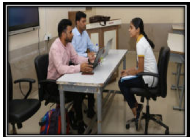
Employers conducting interview