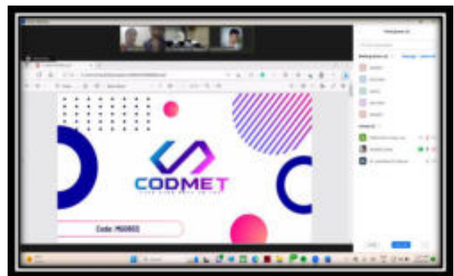
Screenshot of participant showcasing their innovative business ideas.