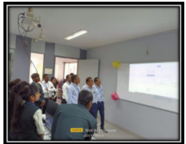
Students while Demonstrating their Application