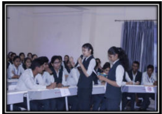
Participants at Talent Hunt 2.0