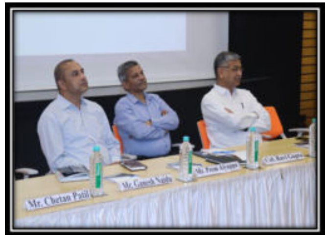
Dignitaries of the session