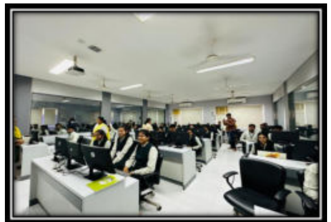
The students at Techno Fair 2023