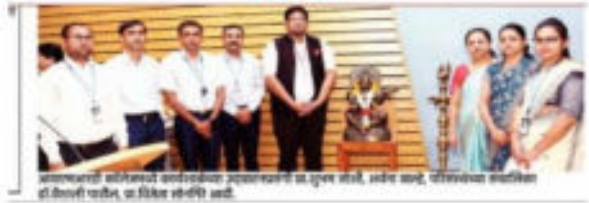
आयएमआरडी कार्यक्रमांत सहभागी सरकारी अधिकारी कार्यालय