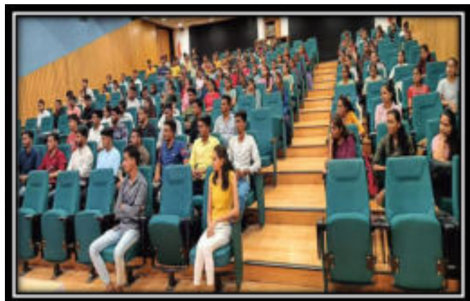
Students at Infosys Skill Development Training