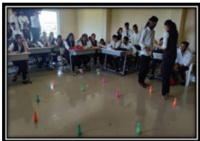
Activity in Infosys Skill Development Training