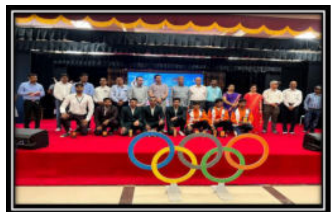
Rewarding achievements in Sports by the dignitaries