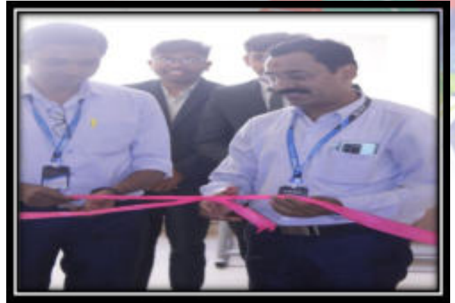
Inauguration of Talent Hunt 2.0 Competition