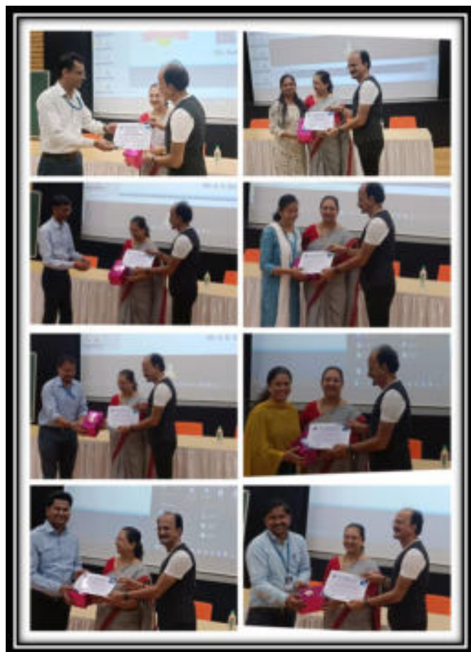
Faculty Members Awarded as Star Performer